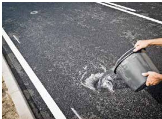
Vandet forsvinder hurtigt ned i asfalten på klimavejen.

Under vejoverfladen er lagt lag af porøse materialer, som kan holde på vandet uden at vejen mister sin bæreevne. Samlet set kan de 50 m vej rumme 120.000 liter vand. Forskerne bag projektet er involveret i den videre udvikling af vejen. Tanken er at konstruere et sandfilter, hvor bakterier og mikroorganismer kan nedbryde de forskellige uønskede stoffer, som vandet fra vejen indeholder.