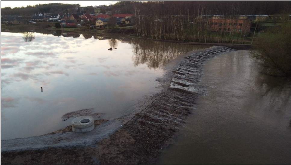
Nødoverløbet i funktion (morgen 23/2)...