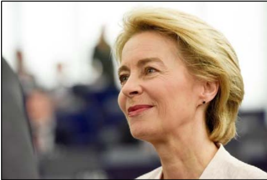
Europa-Kommissionens formand Ursula von der Leyen