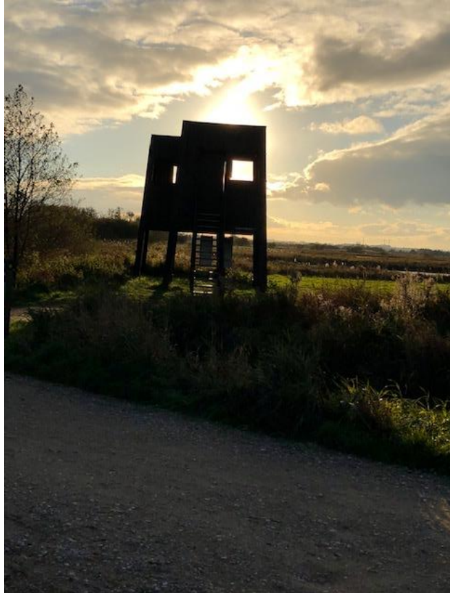
Billede 3 Fugletårn i Uldum kær