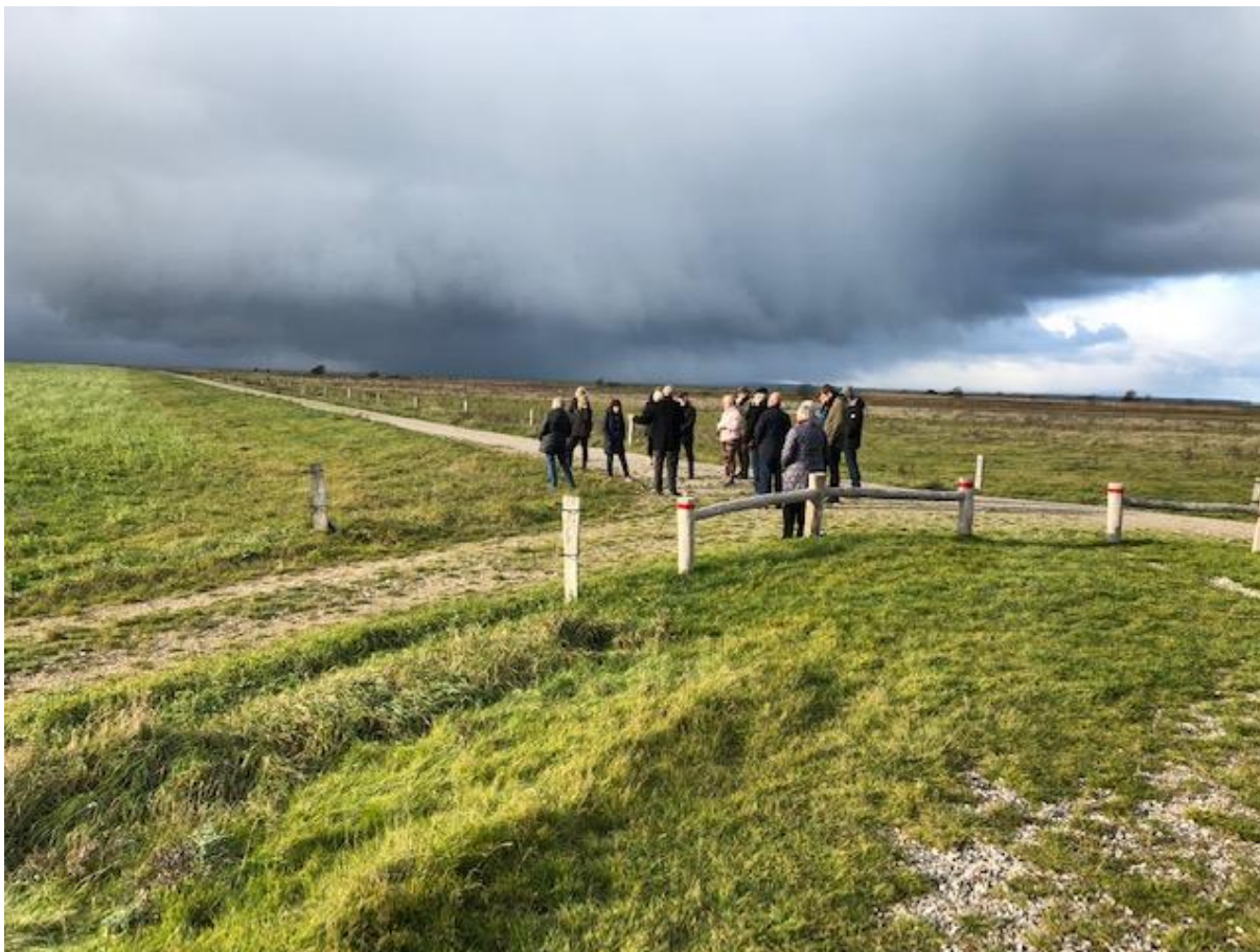
Billede 2 Gyldensten ved Bogense, en ferskvands lagune og en saltvandslagune der tiltrækker en masse fugle året rundt.