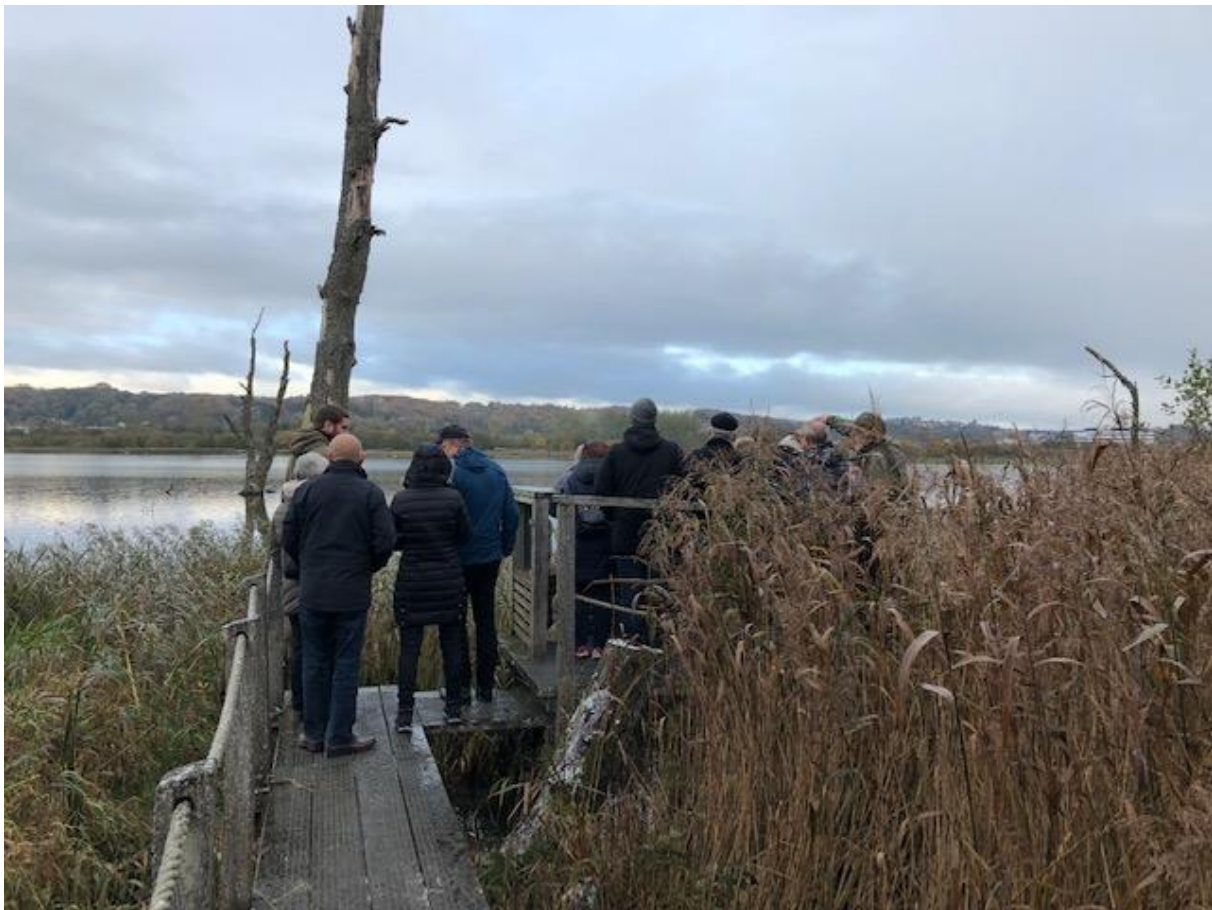
Billede 1 Hævet træbro der giver mulighed for at komme helt ud til vandet. Vejle Ådal.

Formål: Inspirationstur ud og se andre projekter hvor der er håndteret klimavand og hvordan de projekter har formået at give merværdi til områderne i form af forskellige rekreative tiltag. Turen skal inspirere borgerne til at se muligheder i klimavand og hvad vand kan bruges til.