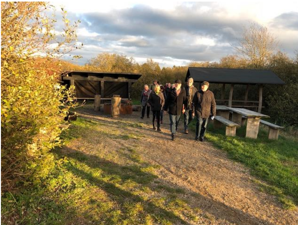
Billede 4 Shelter og bålplads der bliver flittigt brugt i Uldum kær