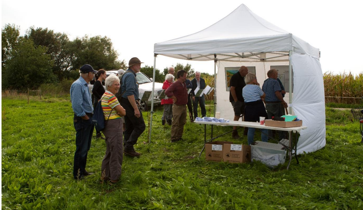
Billede 2 Udstillingsrum med plancher, spørgeskemaer og brochurer.