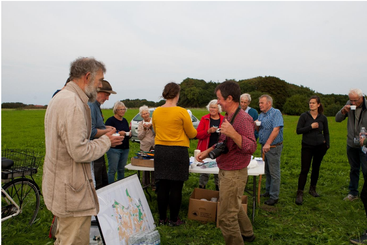
Billede 3 der blev snakket klima og kulturhistorie over kaffen

Gør mere ud af at relatere historierne og oplevelser til klimaudfordringen undervejs – fx hvordan ville det have set ud hvis .... (der var kommet dobbelt så meget regn, hvis vandstanden var ½ meter højere etc) Lola fra Glud museum har lovet at have fokus på denne fælles billeddannelse på næste markvandring)