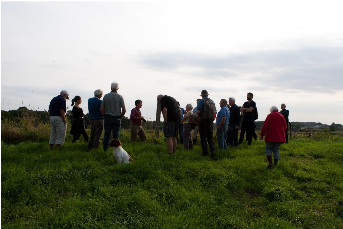
Billede 1 Markvandring i Åstrup kær, vidensdeling om lokale udfordringer, historier og bekymringer.

Formål: Borger drevet klimatilpasning. Lær dit nærområde at kende – markvandring – levevilkår og livsbetingelser i forskellige tids- og klimafaser i Åstrup kær. Øget viden og