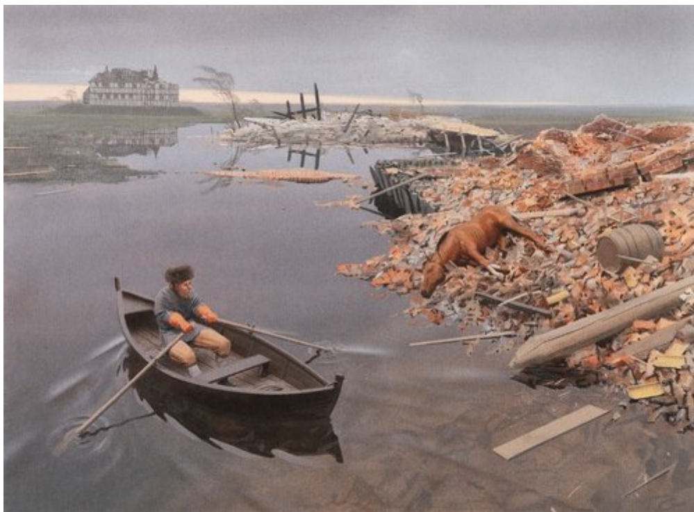
Illustration af ødelæggelserne, som de kan have set ud i dagene efter den store stormflod 1593. Middelalderborgen (Vosborg 1) til højre er helt ødelagt, mens Vosborg 2 i baggrunden er stærkt medtaget. Tegning: Erik Sørensen.