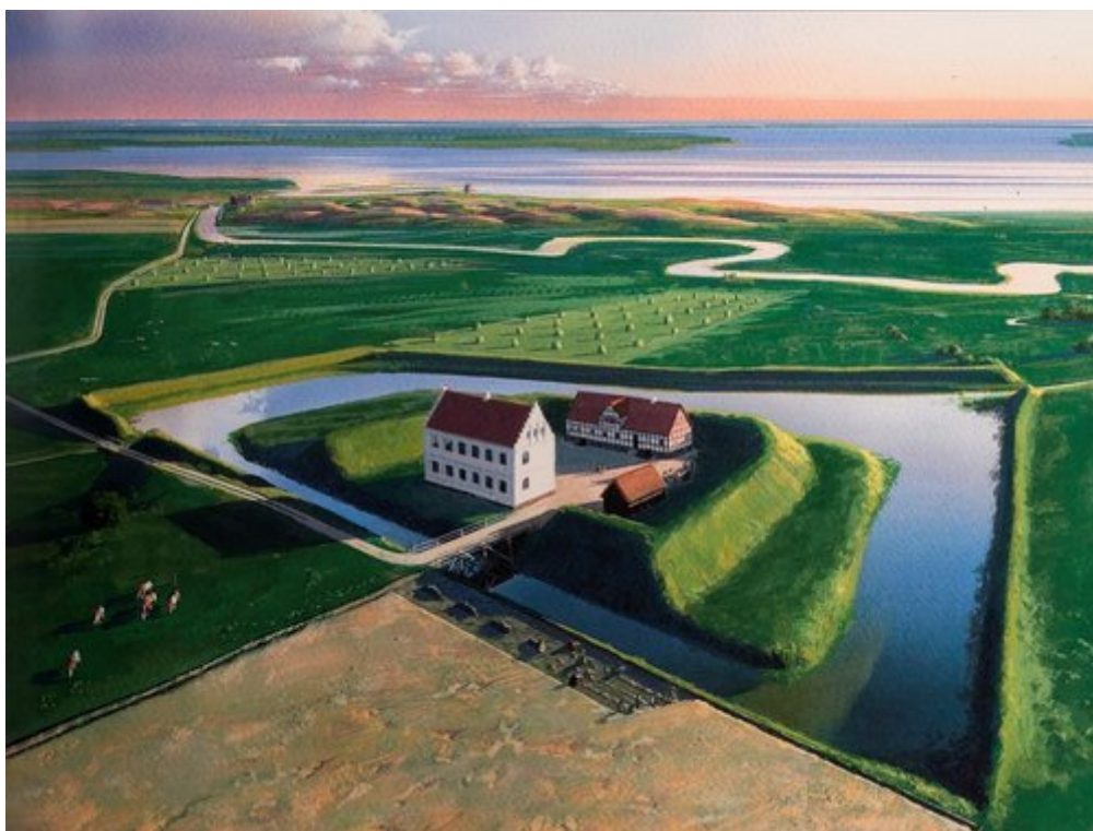
Rekonstruktion med et bud på, hvordan det første Nørre Vosborg (Vosborg 3) kunne have set ud. I baggrunden ses Nørre Vosborg 2 og helt bagerst ruinen af Nørre Vosborg 1. Tegning: Erik Sørensen

Senere er herregården gentagne gange ombygget og udbygget. På vestsiden af gårdspladsen har der stået en bindingsværksbygning med høj sokkel og kælder. I midten af 1700-tallet blev bindingsværksbygningen erstattet af en fuldmuret bygning, som traditionelt kaldes 'De Lindehuset', men da var allerede blevet opført en nordfløj i bindingsværk og med teglhængt tag, kaldet 'Ide Langehuset'. Dateringen af tømmeret fra bygningen viser, at den må være opført 1655 eller ganske kort derefter.