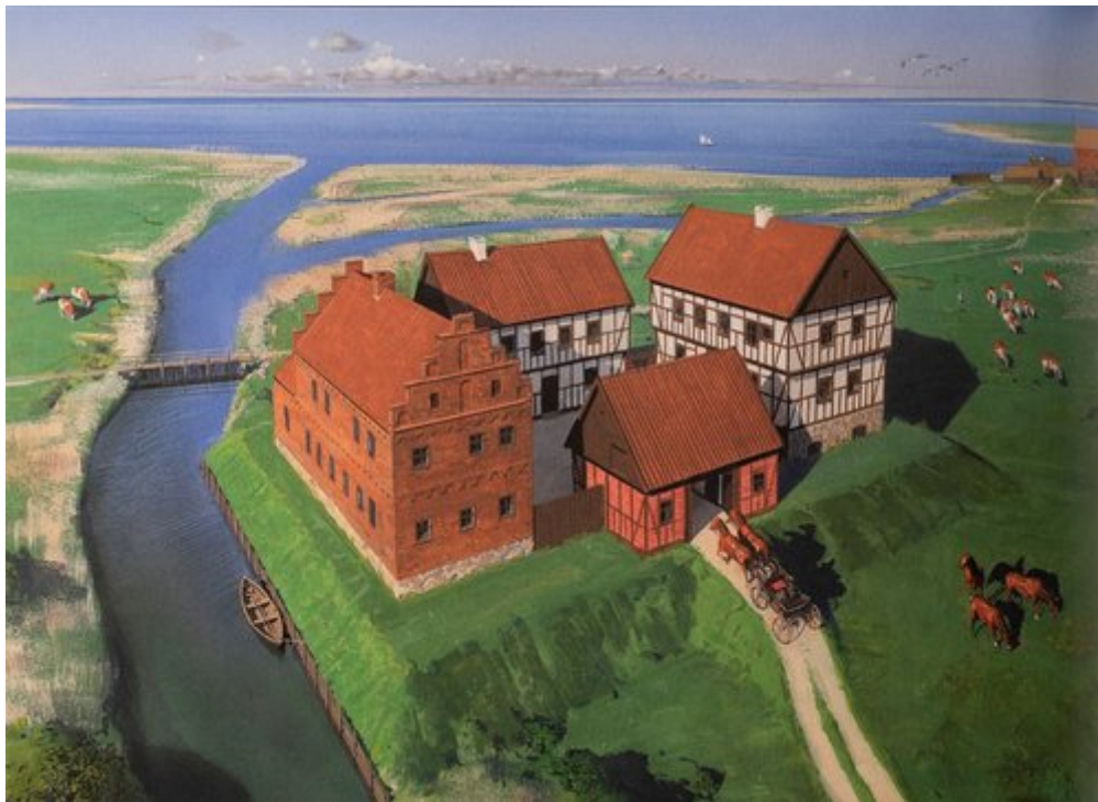
Renæssanceherregården Vosborg 2, som man formoder den har set ud i sidste halvdel af 1500-tallet. Tegning: Erik Sørensen

Både præstens årbog fra Aalborg og en ti år senere beretning fra København fortæller, at stormfloden i 1593 ødelagde eller stærkt beskadigede Vosborg 2. I foråret 1594 fik ejeren da også bevilget hjælp af kongen til genopbygning af beskadigede bygninger. De arkæologiske undersøgelser på Vosborg 2 viste dog ikke tegn på direkte ødelæggelser som følge af forhøjet vandstand eller egentlig stormflod. Der er mange indikationer på, at bygningerne i løbet af ret kort tid er blevet revet ned, formentlig dog ad flere omgange. Mindre lag af sand kunne være tegn på, at nedrivningen er foregået i en periode med en del storme. I terrænet rundt om ses da også flere mindre sandklitter, dog af ukendt alder.